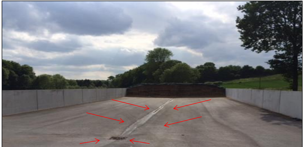
Abbildung 1: Entwässerung von Silagelagerungen.

Das auf der nicht mittels Folie abgedeckten Silagelagerung anfallende Wasser ist in Hinblick auf den Gewässerschutz als belastet einzustufen und muss aufgefangen, in einem Behälter zwischengelagert und landwirtschaftlich verwertet werden. Die Bodenplatte ist daher mit einem stetigen Gefälle (mind. 1%) auszubilden, welches die sichere Ableitung des Silagesickersaftes und des verunreinigten Wassers in Richtung